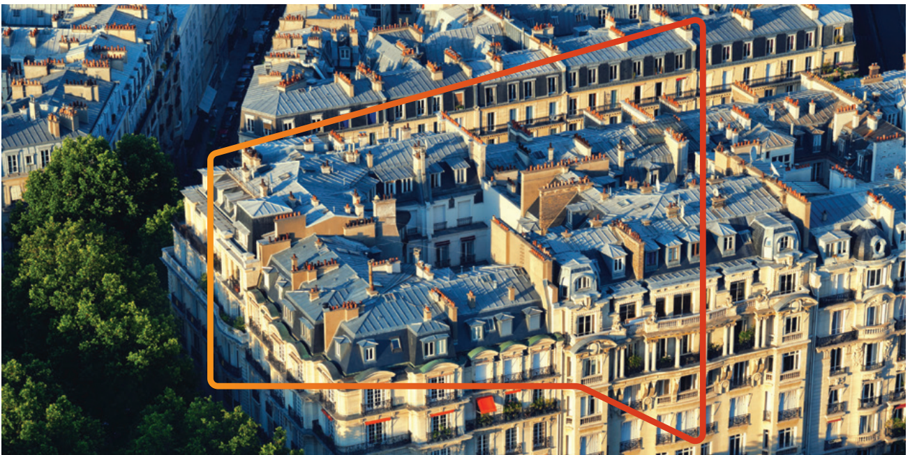
Daken van Parijs

Van bij de oprichting van Vieille Montagne in 1837 tot op vandaag bewijst VMZINC® zich in de meest uiteenlopende, tot de verbeelding sprekende architecturale projecten. Met VMZINC® is VM Building Solutions de enige speler in de markt met zo'n lange staat van dienst. Doe uw voordeel met deze kennis en ervaring die bijna twee eeuwen overspant, een garantie op zich.