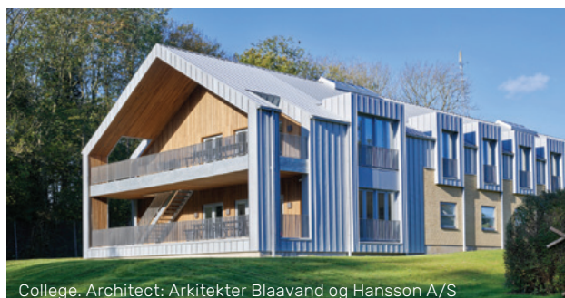
College. Architect: Arkitekter Blaavand og Hansson A/S

Op de geselecteerde VMZINC® producten bieden we daarom met een gerust gemoed een garantie van 50 jaar aan.*