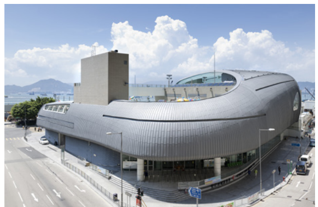
Kennedy Town Swimming pool (Hong Kong) - Architect: TFP Farrells